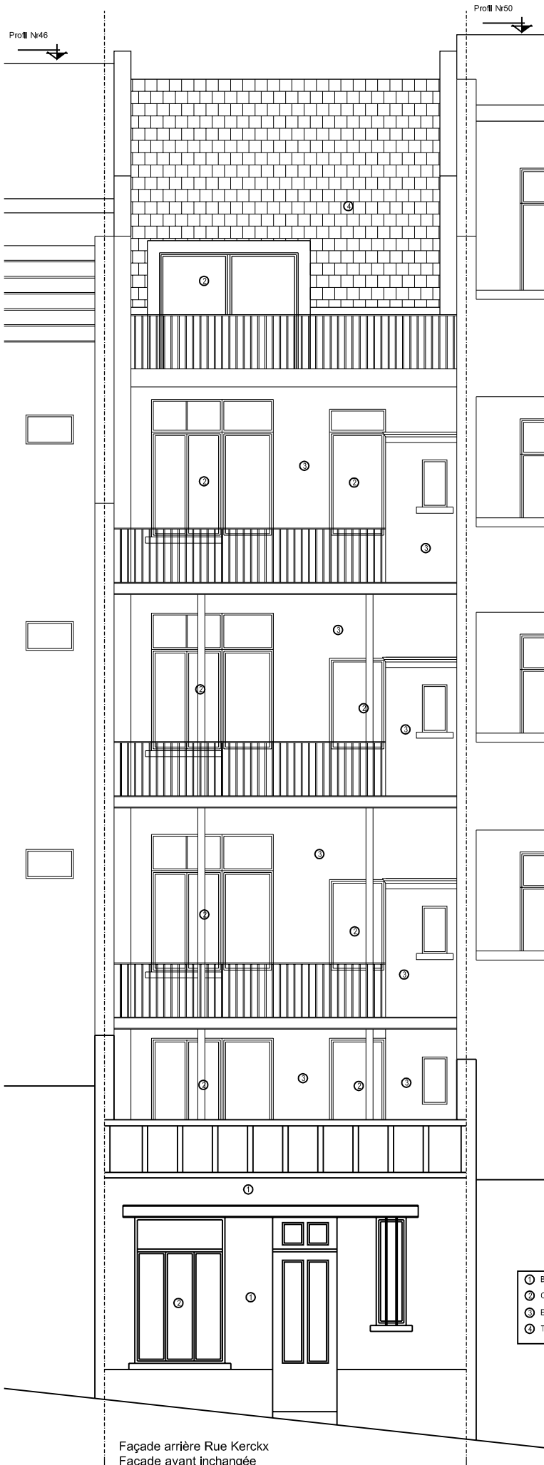
Façade arrière Rue Kerckx Façade avant inchangée